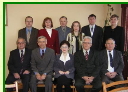
Кафедра теоретической физики, 1995 г.