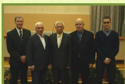
Мозырские делегаты с руководством БФО