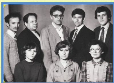
Кафедра теоретической физики, 1983 г.