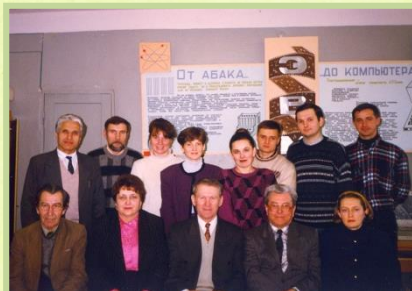
Кафедра математики и информатики, 1995 г.