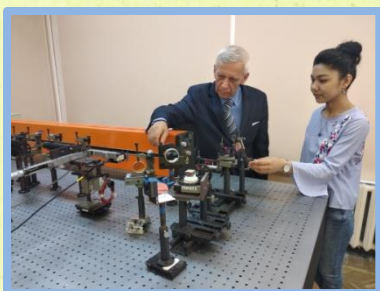
Работа с аспирантами

Материально-техническую базу кафедры составляют: учебная аудитория – № 118; лаборатории вычислительной техники – № 119, 120, 123, 124; лаборатория радиотехники – № 302; кабинет теоретической физики и астрономии – № 304; учебная аудитория с интерактивной доской – № 313; лаборатория когерентной оптики и голографии – № 416; лаборатория компьютерного моделирования и технических средств обучения с интерактивной доской – № 424; лаборатория общей электротехники с интерактивной доской – № 463.